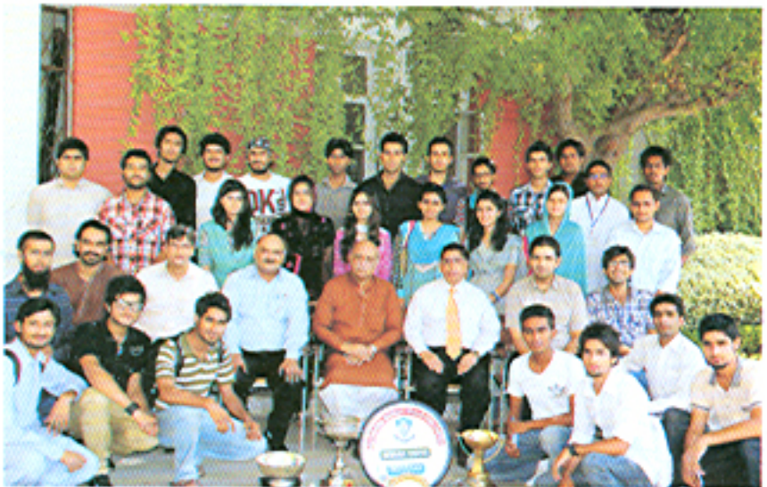
ڈرامہ، شارٹ فلم اور تقریری مقابلوں میں پوزیشنز حاصل کرنے والے طلبہ کا محترم وائس چانسلر کے ساتھ گروپ فوٹو