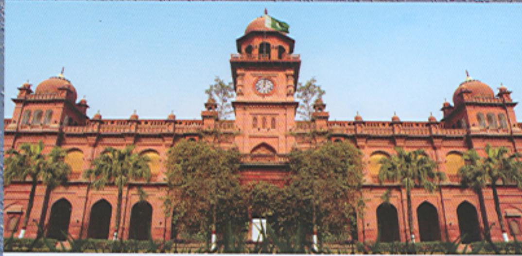
Allama Iqbal Campus