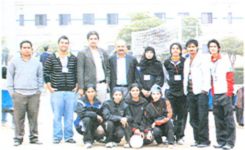
پنجاب یونیورسٹی کی طالبات فاسٹ یونیورسٹی اسلام آباد میں والی بال ٹیم کے جیتنے کے بعد